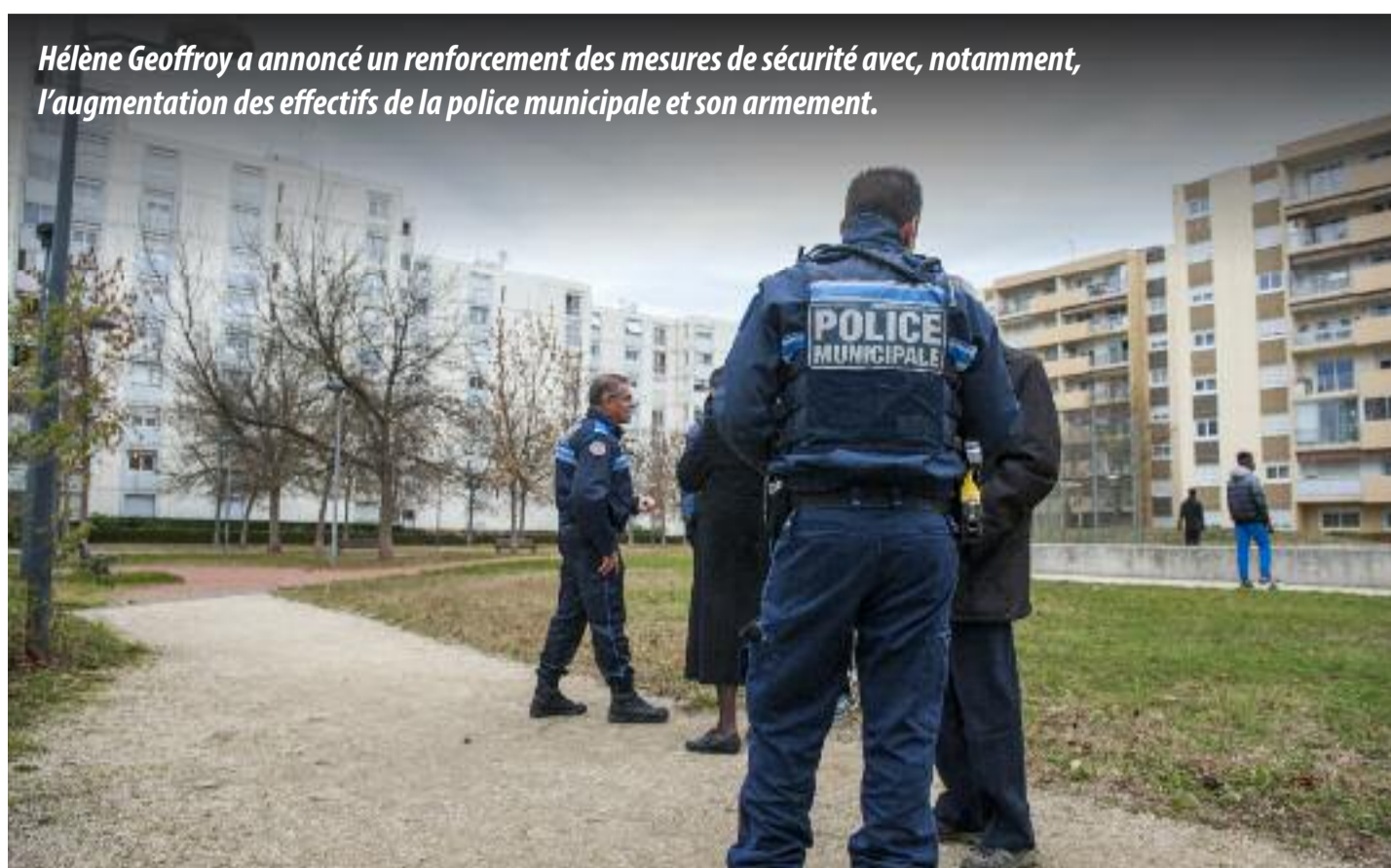
Hélène Geoffroy a annoncé un renforcement des mesures de sécurité avec, notamment, l’augmentation des effectifs de la police municipale et son armement.

“J’ai aussi demandé des moyens supplémentaires aux forces de police pour construire de façon pérenne une offre de sécurité” , a ajouté l’élue. “C’est une chose qui, j’en suis sûre, sera accueillie favorablement par les habitants” . Dès le 28 mai, la municipalité avait déjà rencontré le préfet chargé de la Sécurité, le procureur de la République et le directeur départemental de la sécurité publique pour obtenir le renfort d’une centaine de policiers