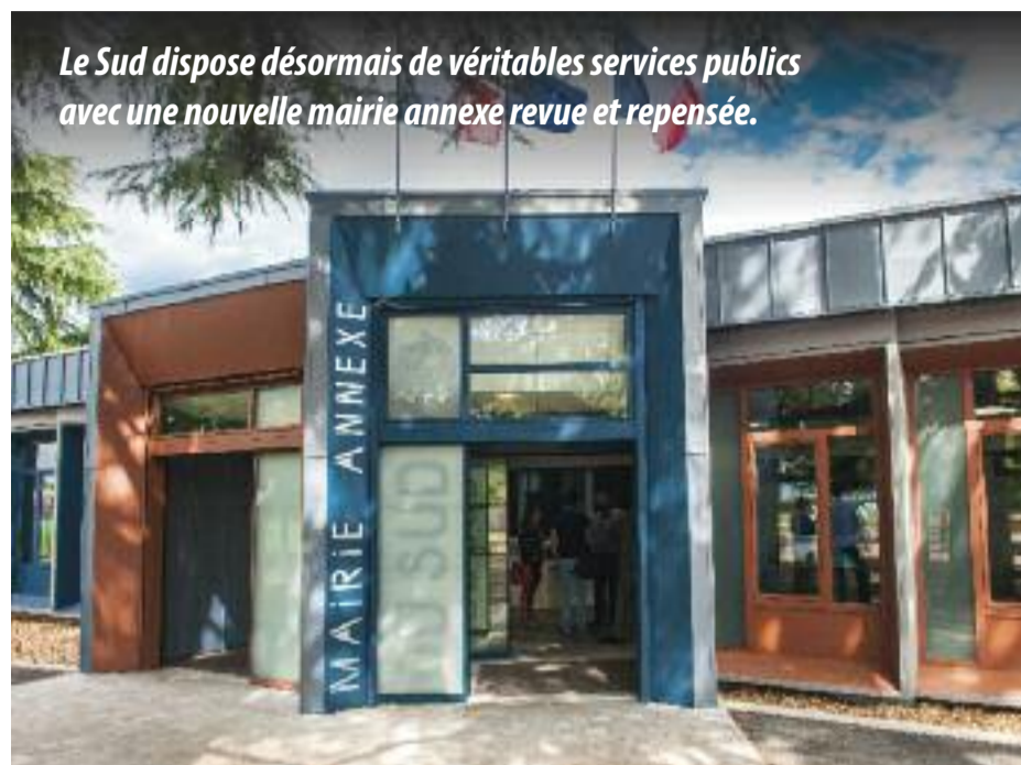
Le Sud dispose désormais de véritables services publics avec une nouvelle mairie annexe revue et repensée.

"Ce nouvel équipement va permettre d'avoir