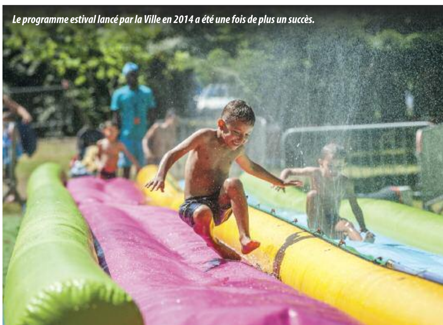
Le programme estival lancé par la Ville en 2014 a été une fois de plus un succès.